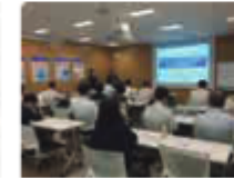
事例・ソリューションセミナー